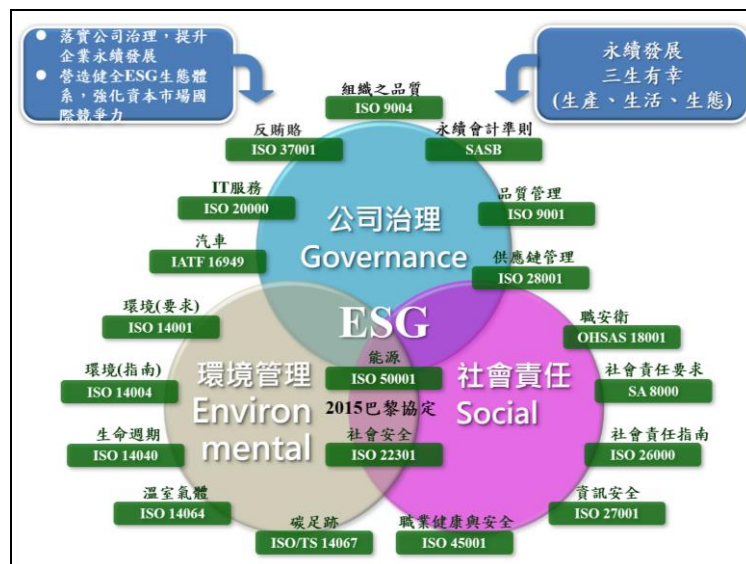
圖三：ESG-整合管理系統

如前所述，殊不論誰優誰劣，對一企業組織的經營管理而言，不就是在能獲取合理利益的前題之下，而能掌握機會、避免風險加上應對策略，達到永續經營的目的。未來，企業應將管理系統的整合納為考量，也可以稱為“ ESG-整合管理系統 ”。其架構如圖三所示。其詳細內容請參考 2021 年 3 月出刊的《品質月刊 57 卷 3 期》。 [6]