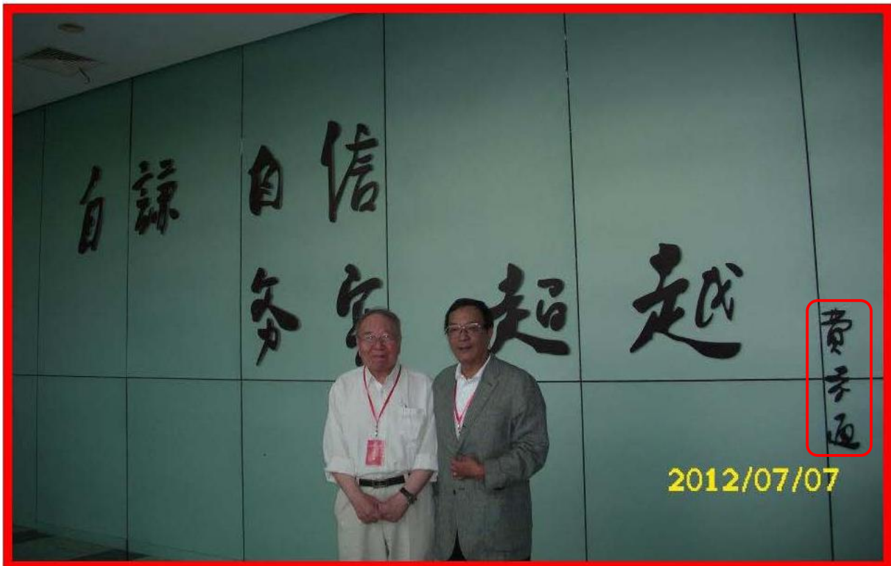
圖五：筆者與兩位近代院士級學者的交流

這兩位受尊敬的學者在人生最為輝煌的歲月，文革期間皆受到極端不公平的對待，但是改革開放得到平反後，仍不改其志，無怨無悔地在自己的專業領域貢獻國家社會而有所成就。群我倫理促進會與遠見研究調查日前公布最新「2019 社會信任調查」 [2] ，結果顯示，每日朝夕相處的「家人」（信任度 95.8%）是台灣民眾最信任的對象，再來是醫生（信任度 91.6%）、中小學老師（82.1%）和基層公務員（78.1%）；與此相較，最不信任的對象依序為新聞記者（不信任度 65.7%）、民意代表（53.8%）、政府官員（54.1%）和法官（52%）。也請吊車尾的人士們，注意個人修為，千萬不可以嚴以律人，寬以待己；只言己之長，專揭人之短；不學無術，薄積厚出；有功則爭，有過則諉。因為你們掌握最多國家社會的資源，應該幹點實事，說點好話，積點陰德；不要把權力當能力，把附和當贊同，把偏見當真理，把盲從當民意。