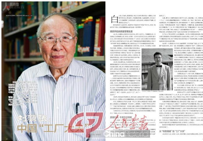
圖二：〈中国“工厂大夫”〉

在大陸方面，有中國品質之父號稱的劉源張，在他的回憶錄《感恩錄：我的品質生涯》一書中以及〈中国“工厂大夫”〉的報導：『在近 60 年品質管理生涯中，劉源張坐過冷板凳，碰過釘子，甚至蒙冤入獄八年多，但始終不改做中國“工廠大夫”的理想，說明中國企業實現產品品質的飛躍。現在，人們稱他“中國品質管理之父”，他卻說要當“品質管理的社會活動家”，為扭轉企業因“無誠信、不認真”而造成的品質危機不斷鼓與呼。』 [5] 如圖二。